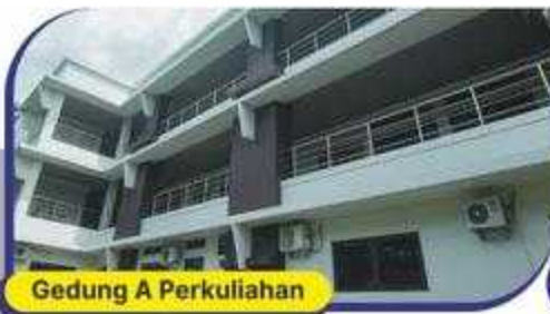
Gedung A Perkuliahan