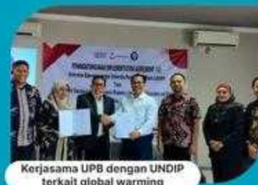
Kerjasama UPB dengan UNDIP terkait global warming