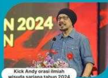
Kick Andy orasi ilmiah wisuda sarjana tahun 2024