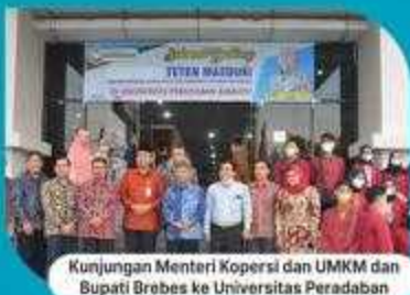
Kunjungan Menteri Koperasi dan UMKM dan Bupati Brebes ke Universitas Peradaban