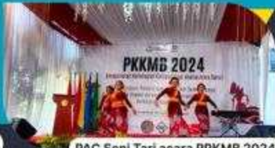
PAC Seni Tari acara PPKMB 2024