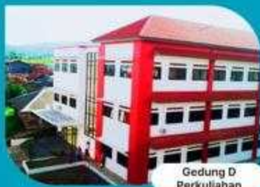
Gedung D Perkuliahan