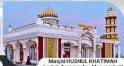
Masjid HUSNUL KHATIMAH (untuk Asrama dan Masyarakat)