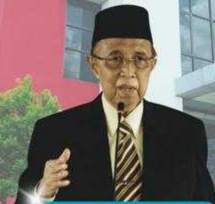
Pendiri Universitas Peradaban

Prof. Dr. Yahya A Muhaimin, M.P.A. Menteri Pendidikan Nasional (Periode 1999 s.d. 2001)