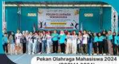
Pekan Olahraga Mahasiswa 2024 (PORMA 2024)