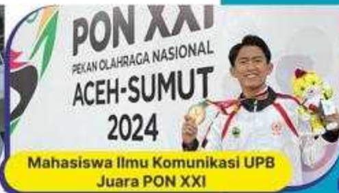
Mahasiswa Ilmu Komunikasi UPB Juara PON XXI